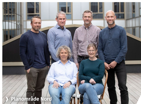
› Planområde Nord