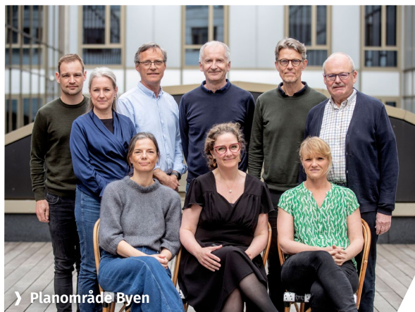
› Planområde Byen